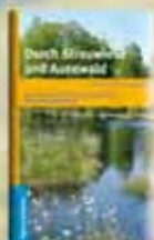
Durch Streuwiese und Auenwald ISBN: 978-3-86615-684-5