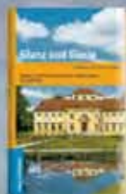
Glanz und Gloria ISBN: 978-3-86615-653-1