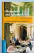
Klosterbräu und Talermwirt ISBN: 978-3-86615-446-9