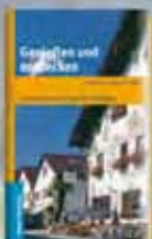
Gemäßen und entdecken ISBN: 978-3-86615-625-8