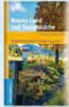
Blaues Land und Teufelsklüfte ISBN: 978-3-86615-686-9