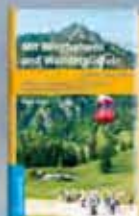
Mit Bergbahnen und Wanderstiefeln ISBN: 978-3-86615-772-9