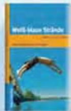
Weiß-blau Strände ISBN: 978-3-86615-444-5