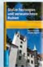
Stolze Festungen und verwunschene Ruinen ISBN: 978-3-86615-685-2