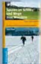
Spuren im Schnee und Wege zum Wandern ISBN: 978-3-86615-445-2