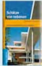
Schätze von nebenan ISBN: 978-3-86615-357-8