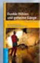
Dunkle Höhlen und geheime Gänge ISBN: 978-3-86615-773-6