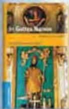
In Gottes Namen ISBN: 978-3-86615-354-7