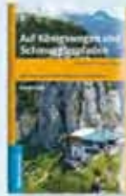
Auf Königswegen und Schmugglerpfaden ISBN: 978-3-86615-356-1