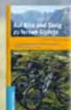
Auf Bike und Steig zu fernen Gipfeln ISBN: 978-3-86615-624-1

Format: 10 x 17 cm, Hardcover, 9,90 Euro (D) / 10,20 Euro (A)