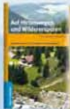
Auf Hirtenwegen und Wildererspuren ISBN: 978-3-86615-443-8