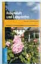
Rosenduft und Labyrinth ISBN: 978-3-86615-442-1