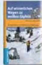
Auf winterlichen Wegen zu weißen Gipfeln ISBN: 978-3-86615-354-8