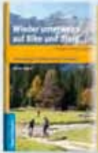
Wieder unterwegs auf Bike und Steig ISBN: 978-3-86615-696-8