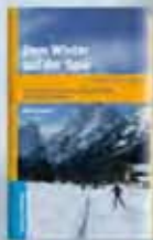
Dem Winter auf der Spur ISBN: 978-3-86615-655-5