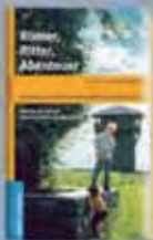
Römer, Ritter, Abenteuer ISBN: 978-3-86615-447-6