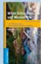
Wilde Schluchten und Wasserfälle ISBN: 978-3-86615-771-2